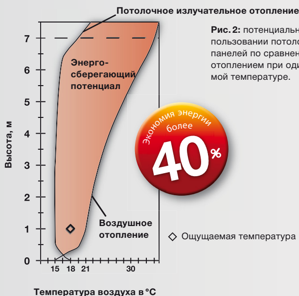
Рис. 2: потенциальная экономия при использовании потолочных излучающих панелей по сравнению с воздушным отоплением при одинаковой ощущаемой температуре.

направлено излучение (у пола). Благодаря этому температура воздуха более равномерна по высоте помещения, что обеспечивает значительно более низкий расход энергии. (Рис. 2)