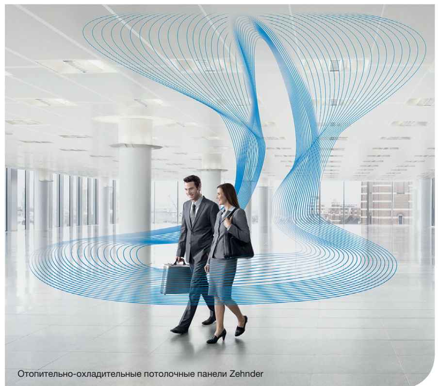
Отопительно-охлаждающие потолочные панели Zehnder