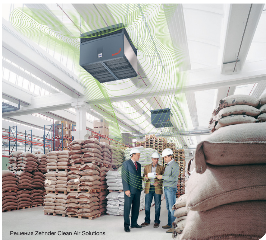
Решения Zehnder Clean Air Solutions